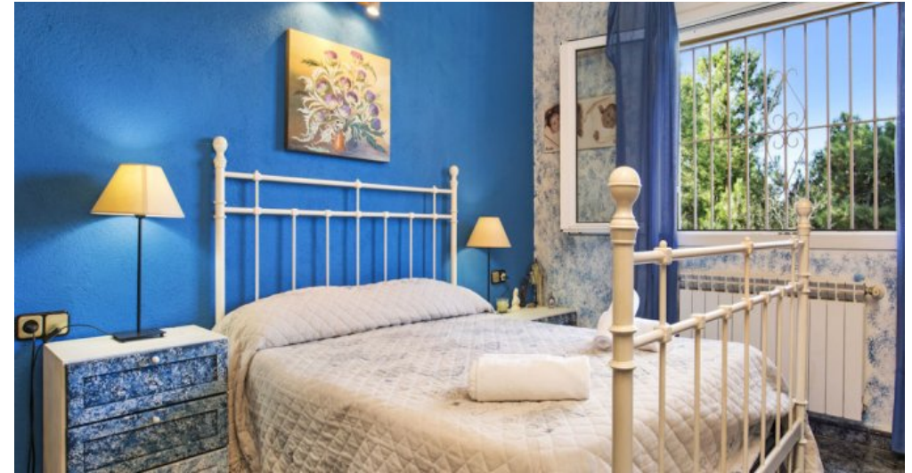
Ferienhaus Lloret Blau an der Costa Brava