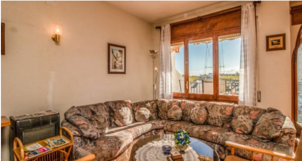
Appartement in Strandnähe in Empuriabrava