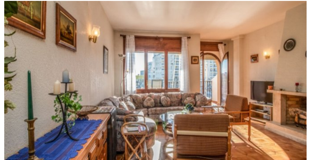
Appartement in Strandnähe in Empuriabrava