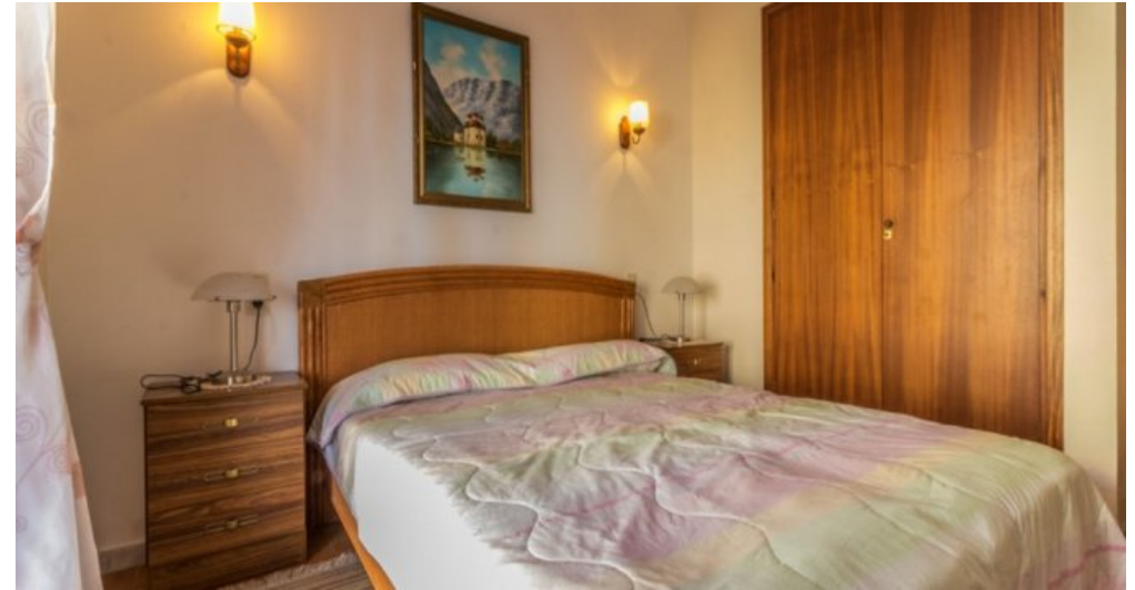
Appartement in Strandnähe in Empuriabrava