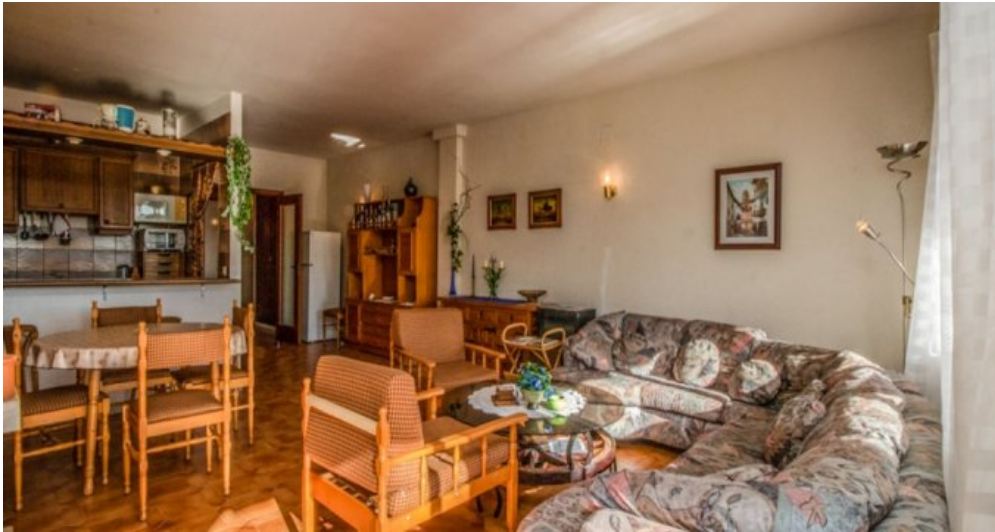
Appartement in Strandnähe in Empuriabrava