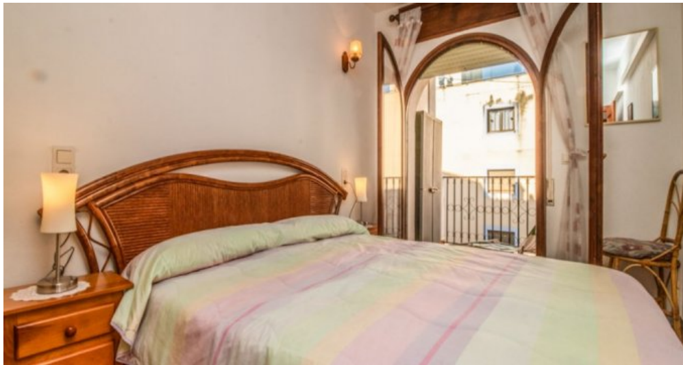
Appartement in Strandnähe in Empuriabrava