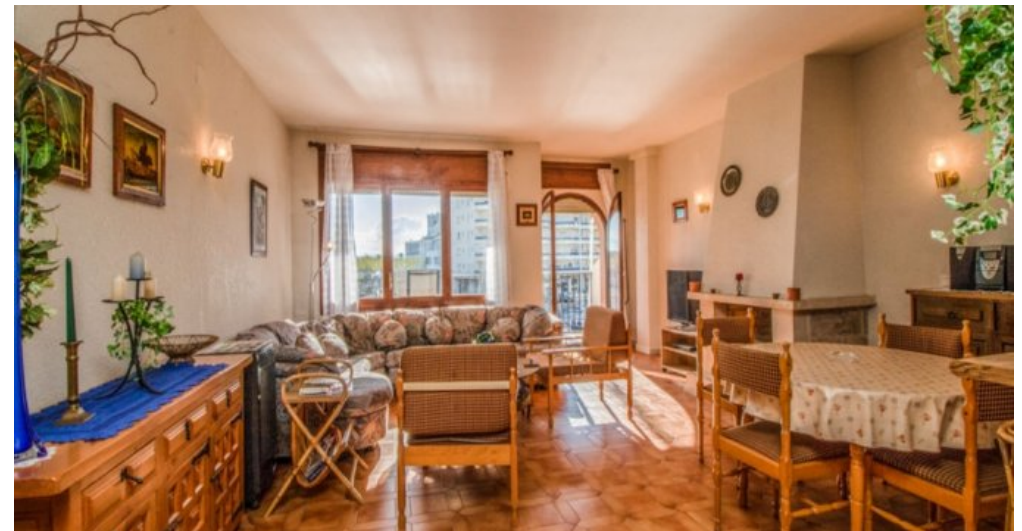
Appartement in Strandnähe in Empuriabrava