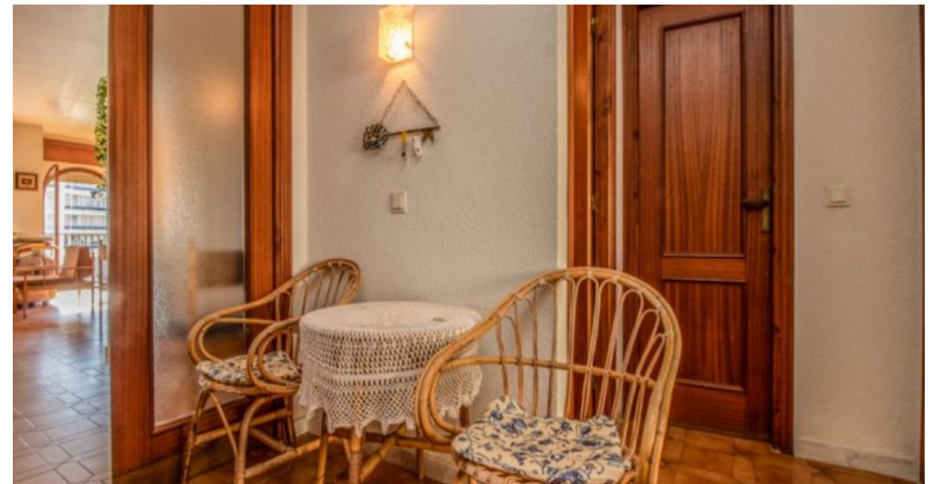
Appartement in Strandnähe in Empuriabrava