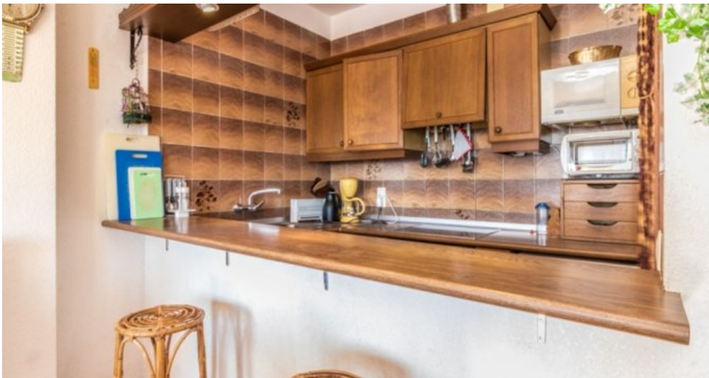
Appartement in Strandnähe in Empuriabrava