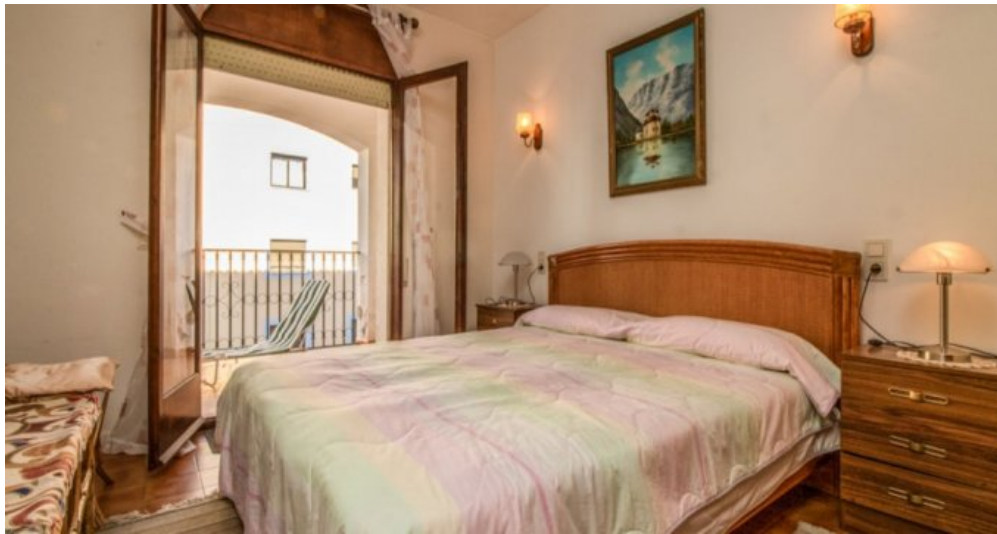
Appartement in Strandnähe in Empuriabrava