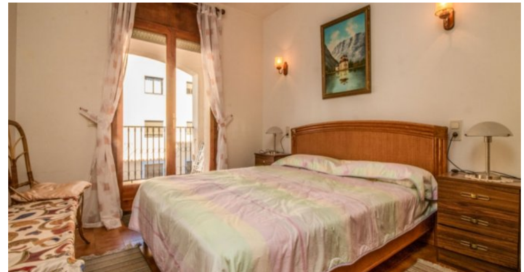
Appartement in Strandnähe in Empuriabrava