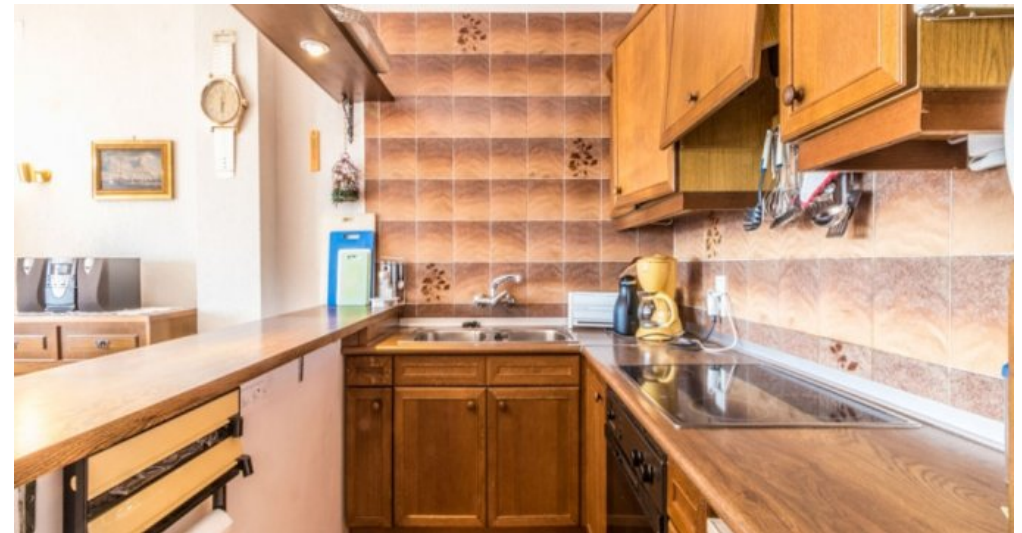
Appartement in Strandnähe in Empuriabrava