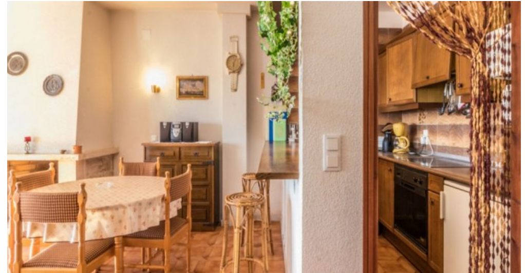
Appartement in Strandnähe in Empuriabrava