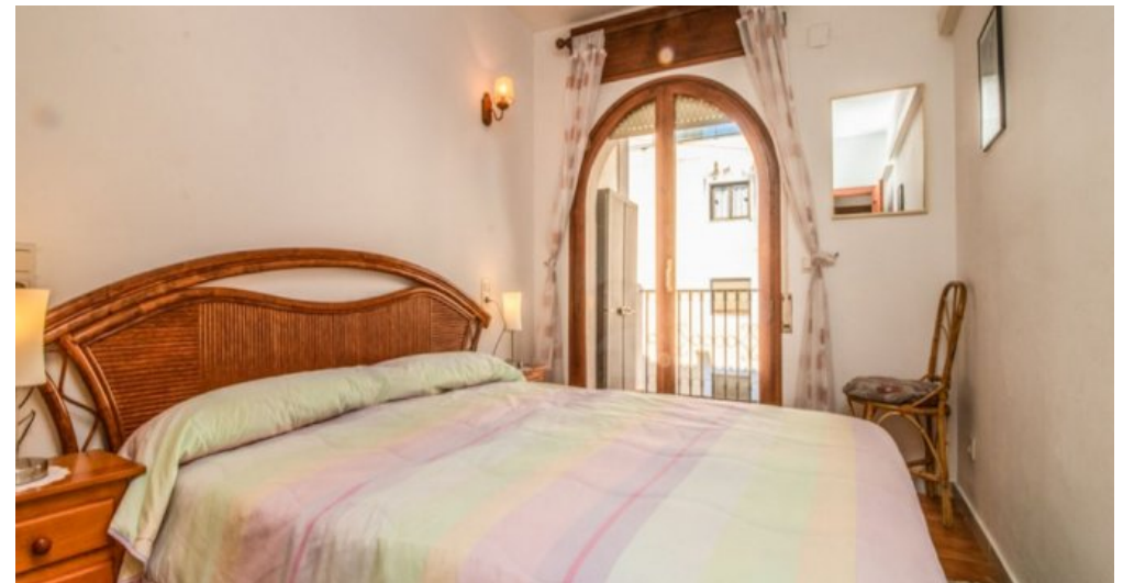
Appartement in Strandnähe in Empuriabrava