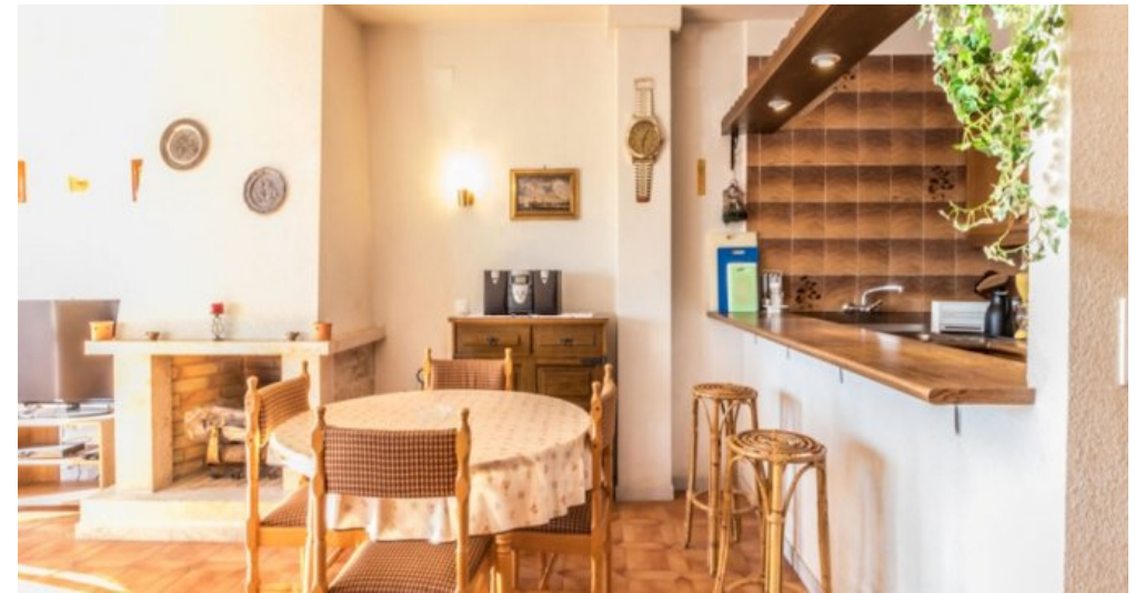
Appartement in Strandnähe in Empuriabrava