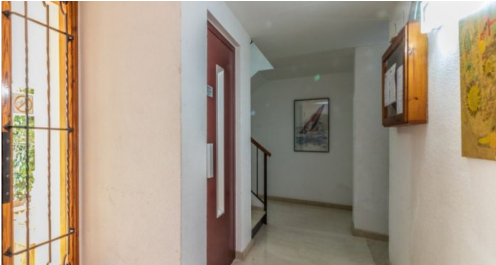
Appartement in Strandnähe in Empuriabrava