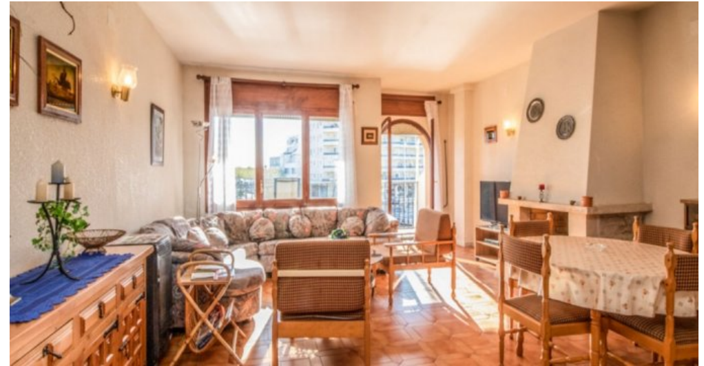
Appartement in Strandnähe in Empuriabrava