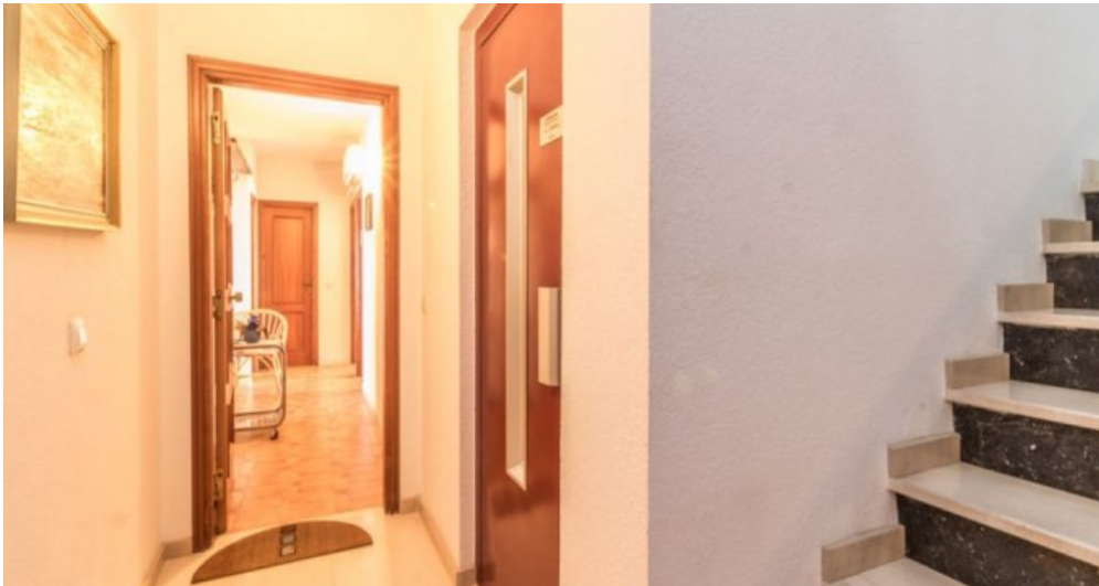
Appartement in Strandnähe in Empuriabrava