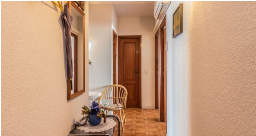
Appartement in Strandnähe in Empuriabrava