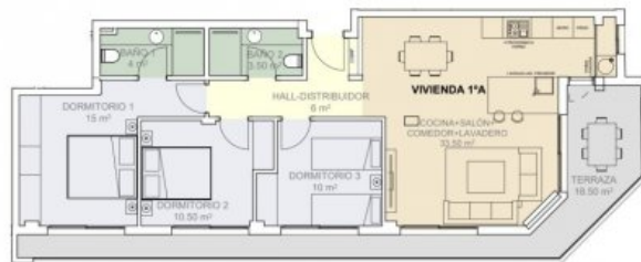
PLANTA PISO 1º VIVIENDA A