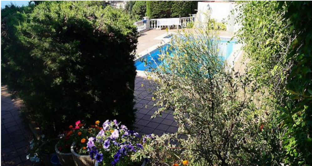
Rustikales Ferienhaus Spanien Costa Brava