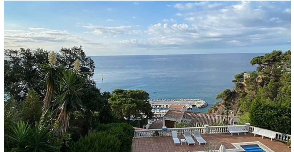
Rustikales Ferienhaus Spanien Costa Brava