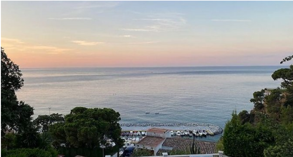
Rustikales Ferienhaus Spanien Costa Brava