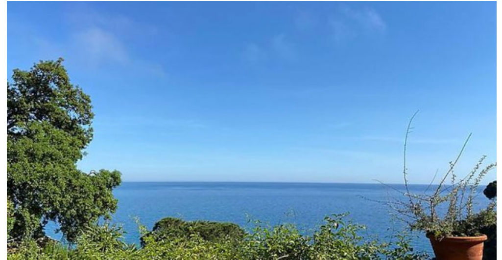
Rustikales Ferienhaus Spanien Costa Brava