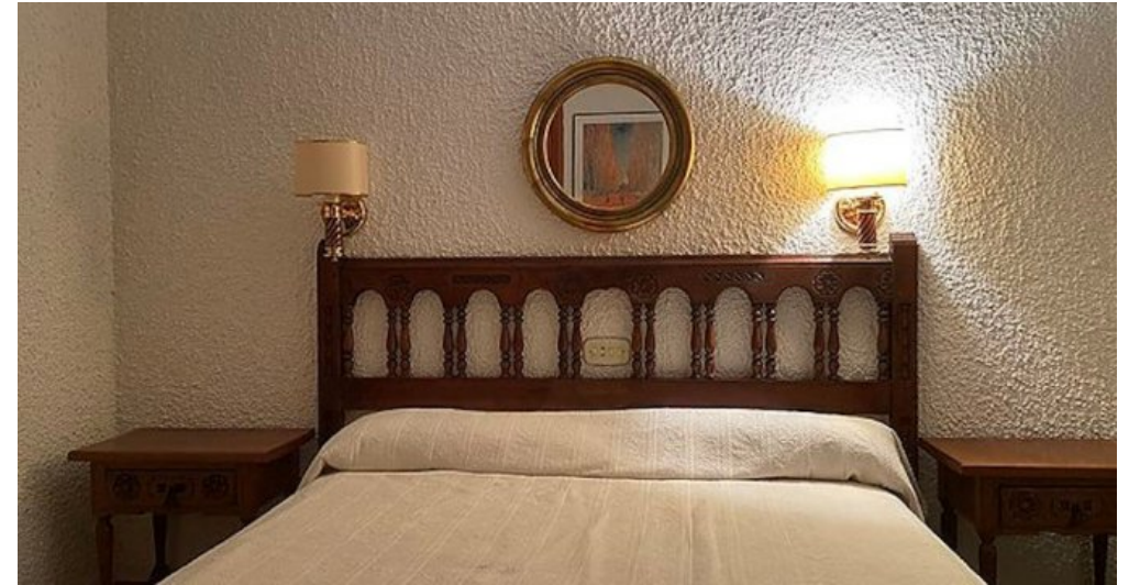
Rustikales Ferienhaus Spanien Costa Brava