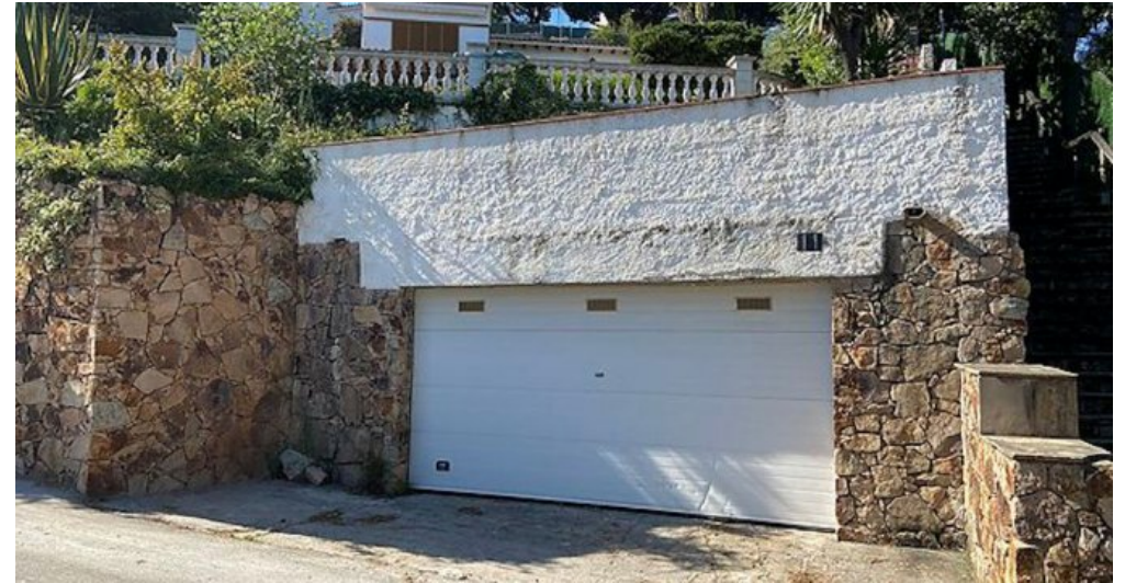
Rustikales Ferienhaus Spanien Costa Brava