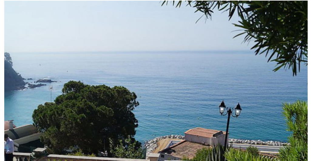
Rustikales Ferienhaus Spanien Costa Brava