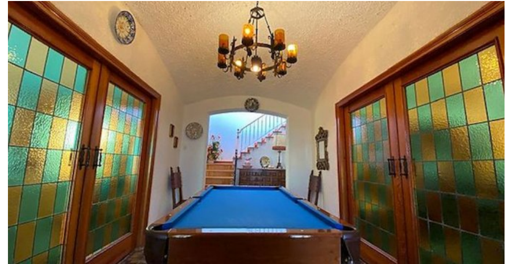
Rustikales Ferienhaus Spanien Costa Brava