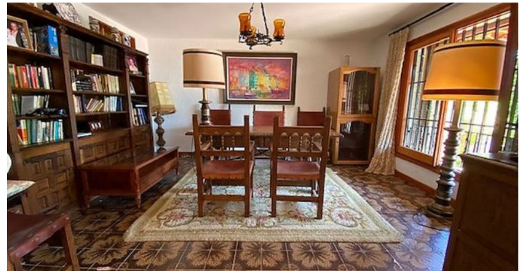
Rustikales Ferienhaus Spanien Costa Brava