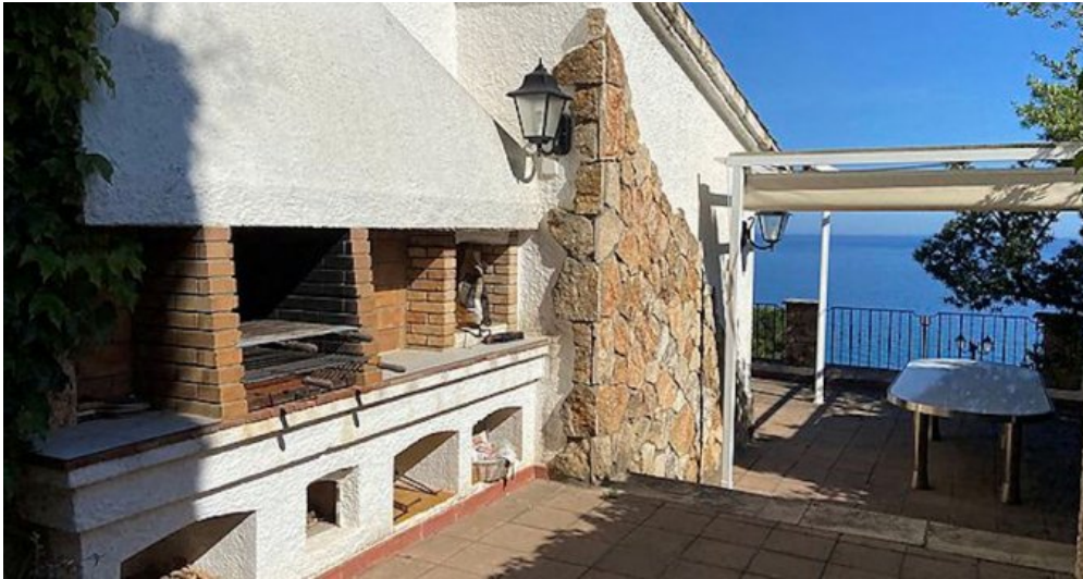
Rustikales Ferienhaus Spanien Costa Brava