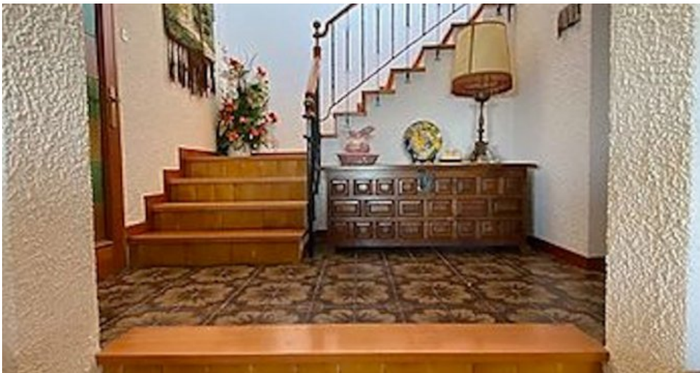
Rustikales Ferienhaus Spanien Costa Brava