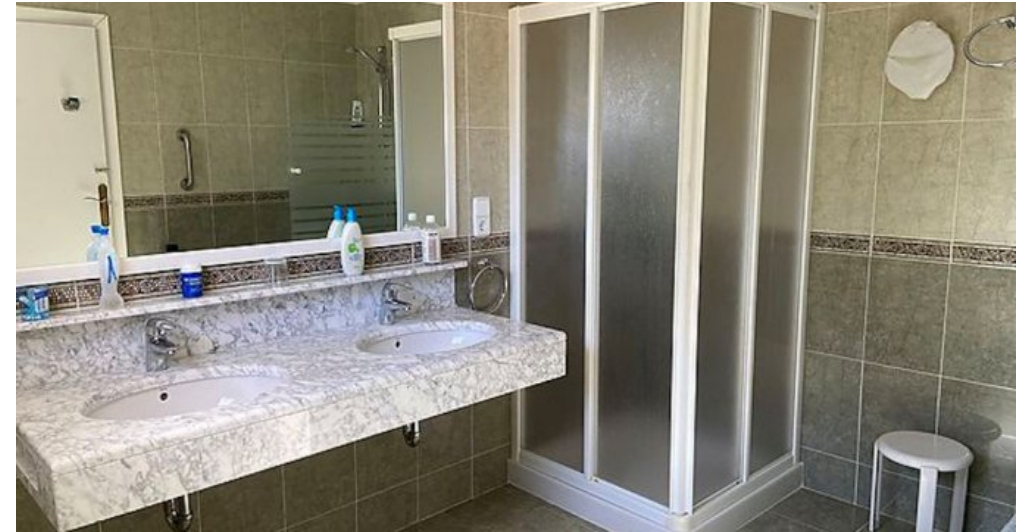
Rustikales Ferienhaus Spanien Costa Brava