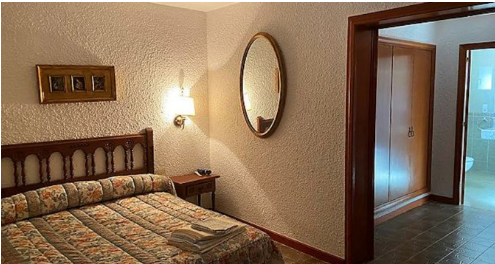
Rustikales Ferienhaus Spanien Costa Brava