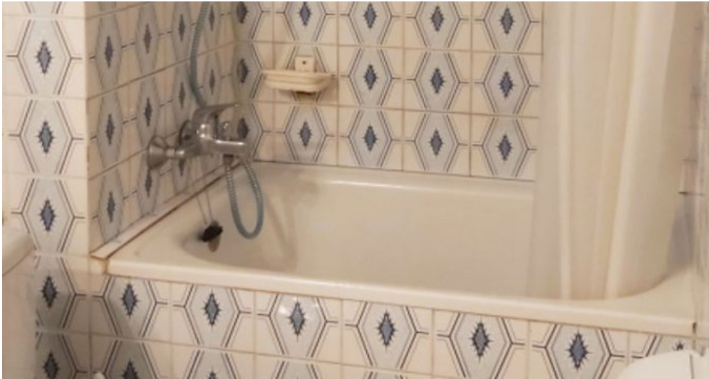
Appartement/Studio am Strand von Empuriabrava