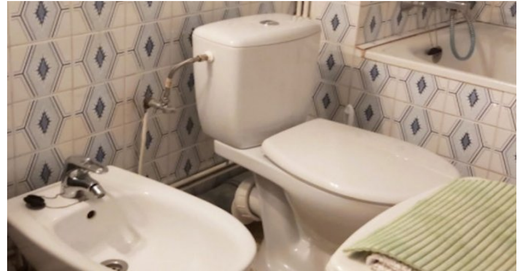
Appartement/Studio am Strand von Empuriabrava