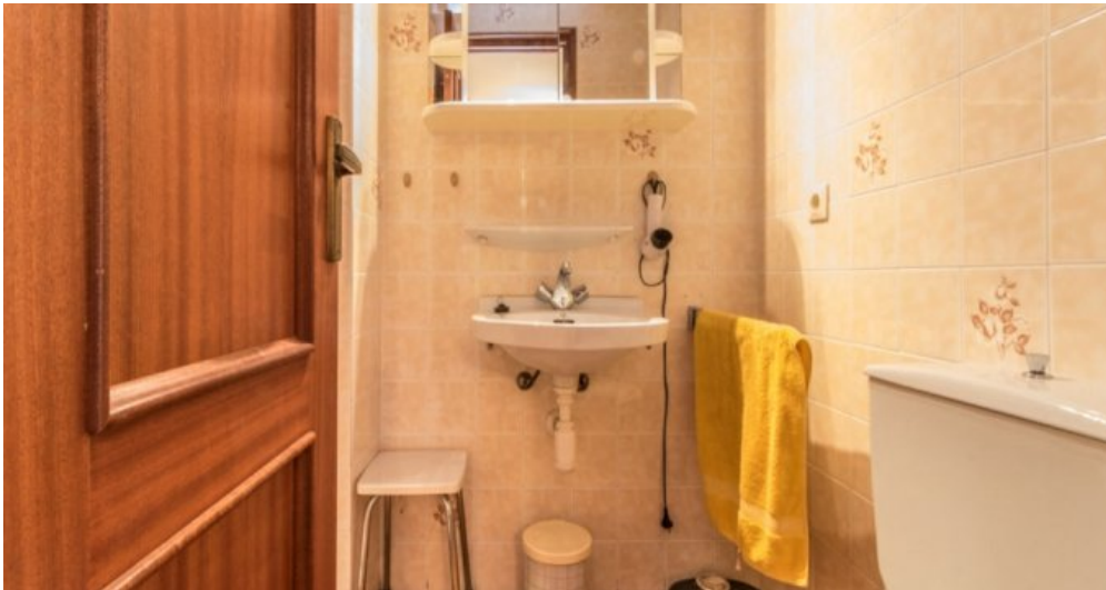
Appartement in Strandnähe in Empuriabrava