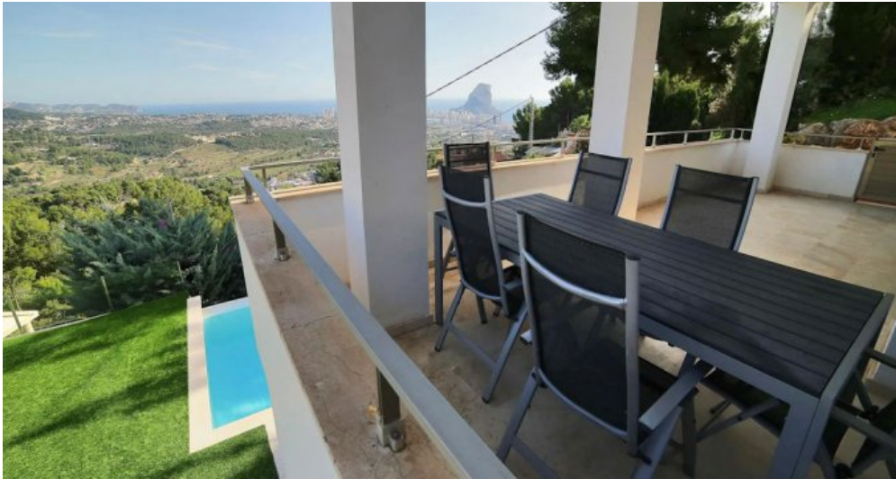
Spanien Ferienhaus in Calpe Costa Blanca