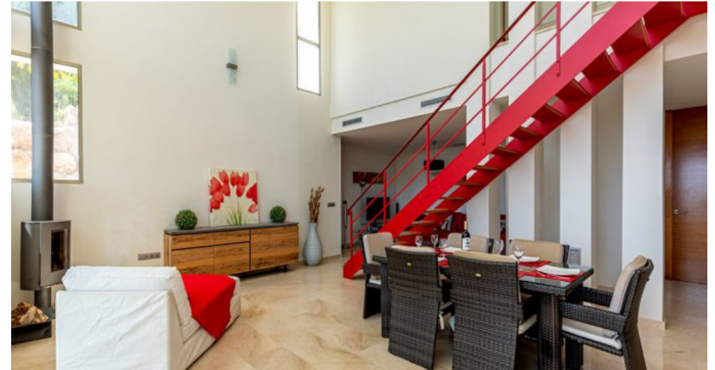
Spanien Ferienhaus in Calpe Costa Blanca