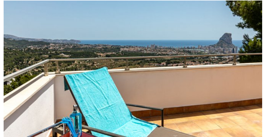
Spanien Ferienhaus in Calpe Costa Blanca