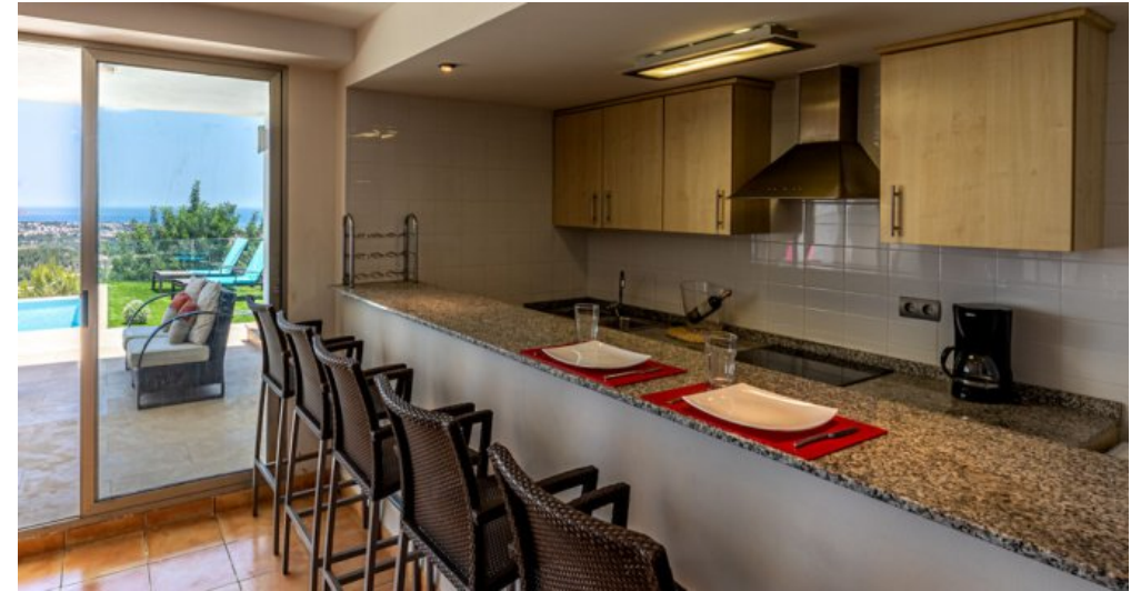
Spanien Ferienhaus in Calpe Costa Blanca