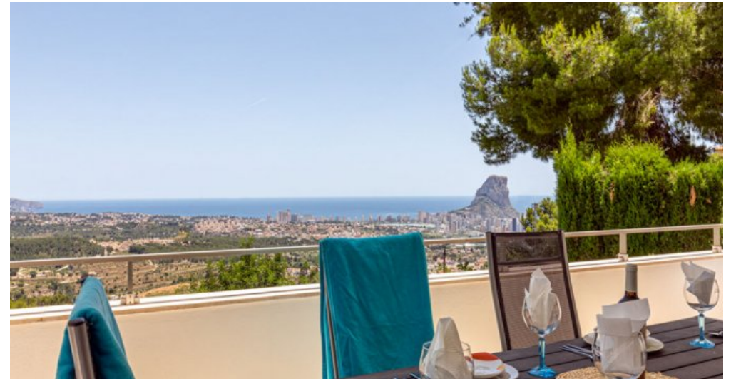
Spanien Ferienhaus in Calpe Costa Blanca