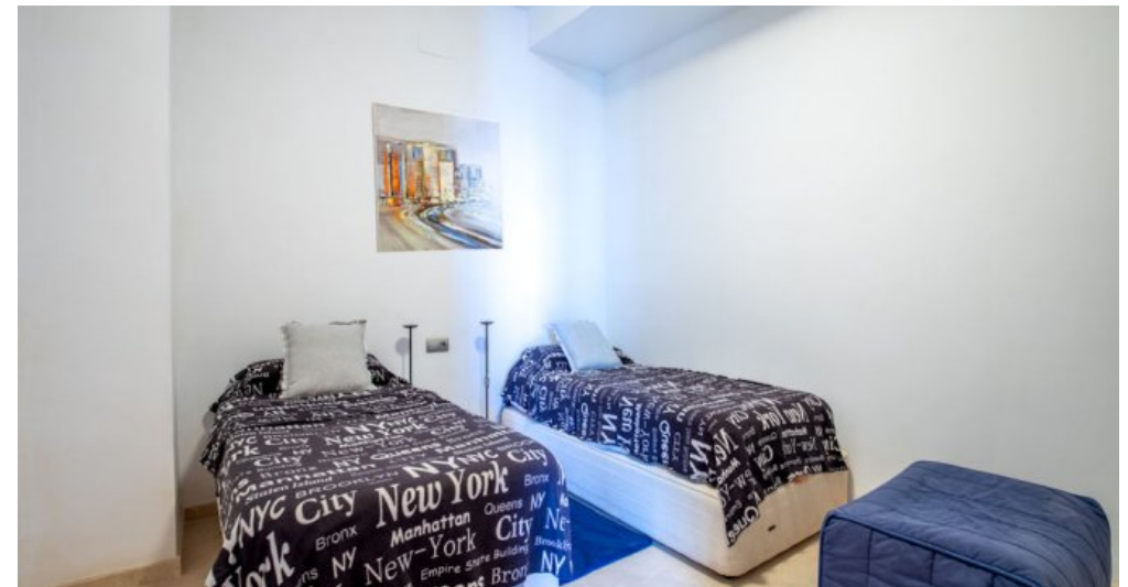
Spanien Ferienhaus in Calpe Costa Blanca