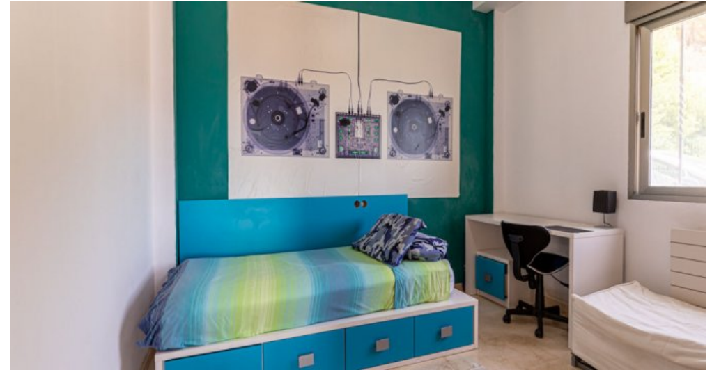
Spanien Ferienhaus in Calpe Costa Blanca