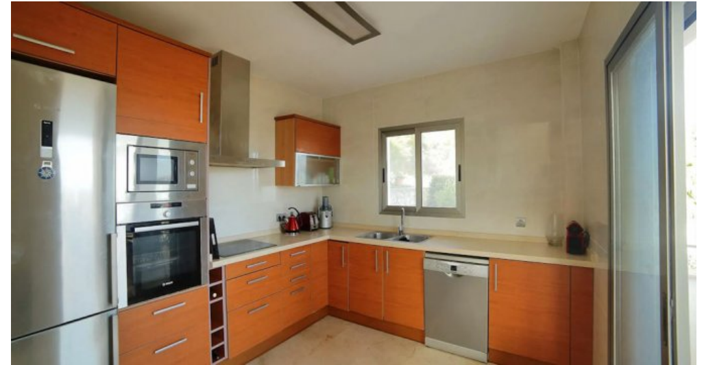
Spanien Ferienhaus in Calpe Costa Blanca