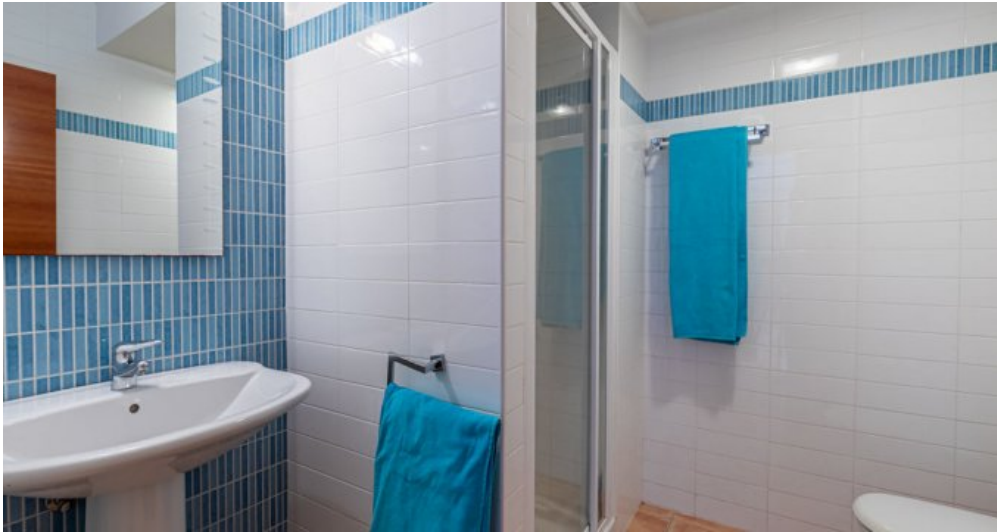
Spanien Ferienhaus in Calpe Costa Blanca