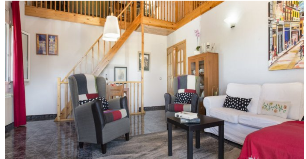
Ferienhaus Lloret Blau an der Costa Brava