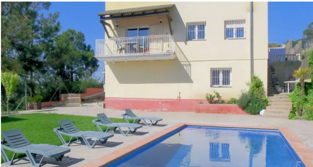
Ferienhaus Lloret Blau an der Costa Brava