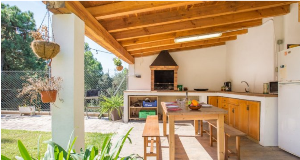
Ferienhaus Lloret Blau an der Costa Brava