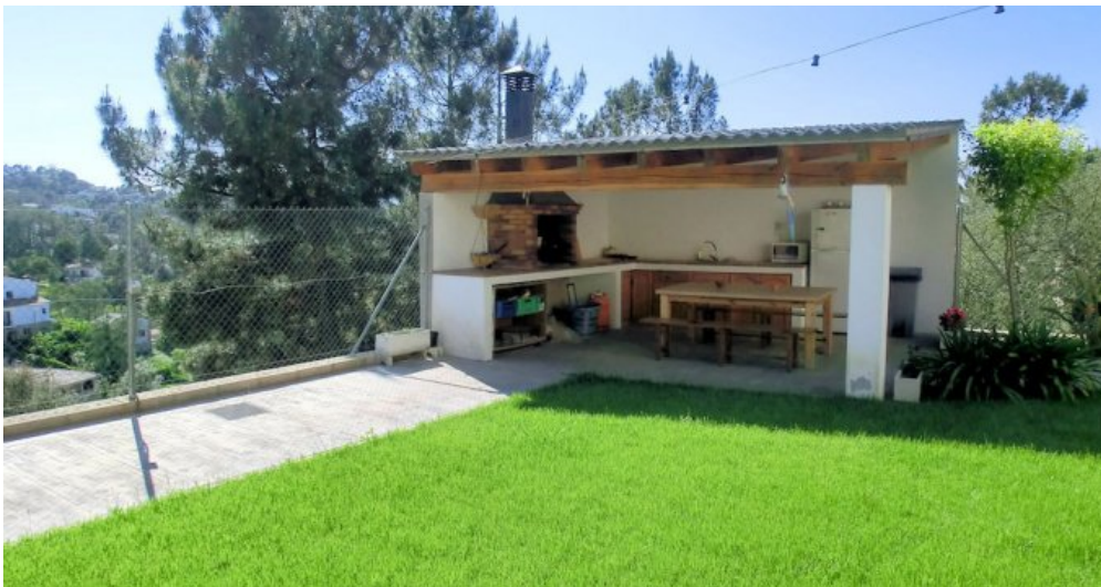
Ferienhaus Lloret Blau an der Costa Brava