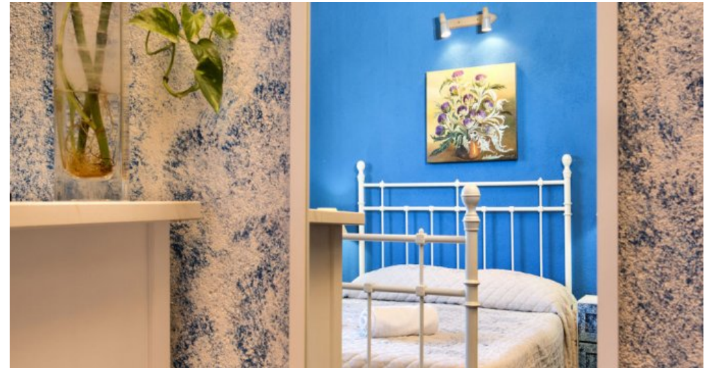
Ferienhaus Lloret Blau an der Costa Brava