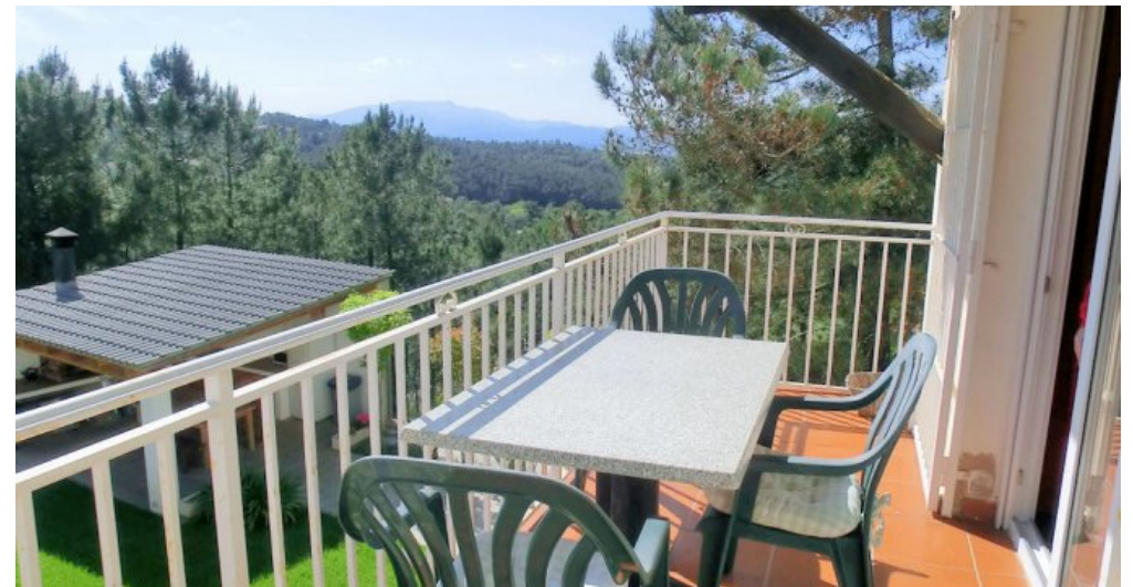
Ferienhaus Lloret Blau an der Costa Brava