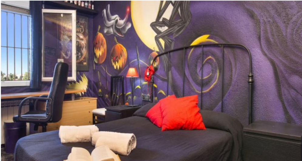
Ferienhaus Lloret Blau an der Costa Brava