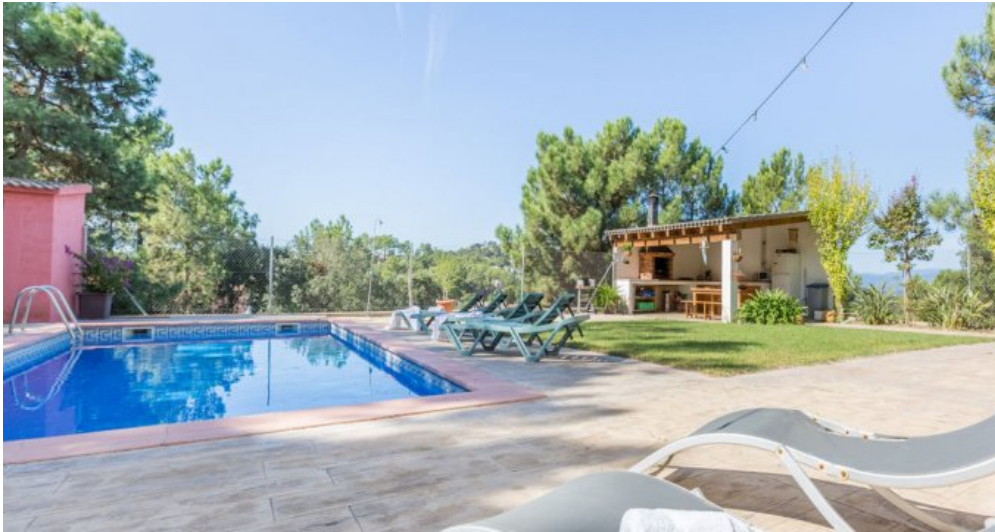
Ferienhaus Lloret Blau an der Costa Brava