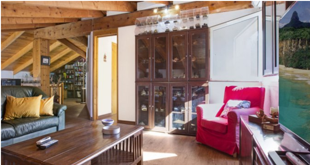
Ferienhaus Lloret Blau an der Costa Brava