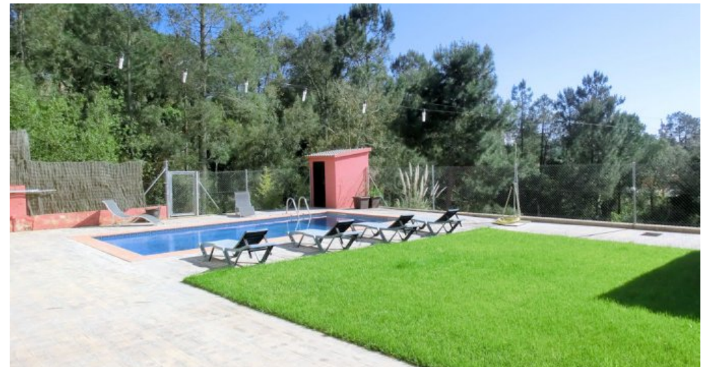
Ferienhaus Lloret Blau an der Costa Brava