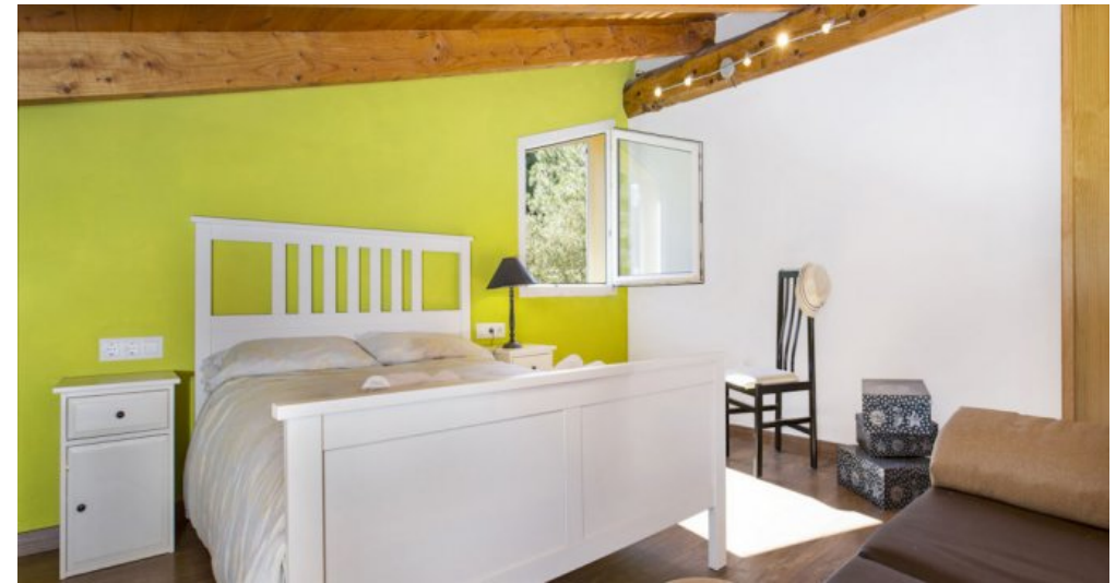
Ferienhaus Lloret Blau an der Costa Brava