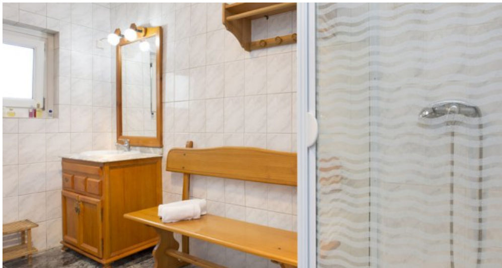
Ferienhaus Lloret Blau an der Costa Brava