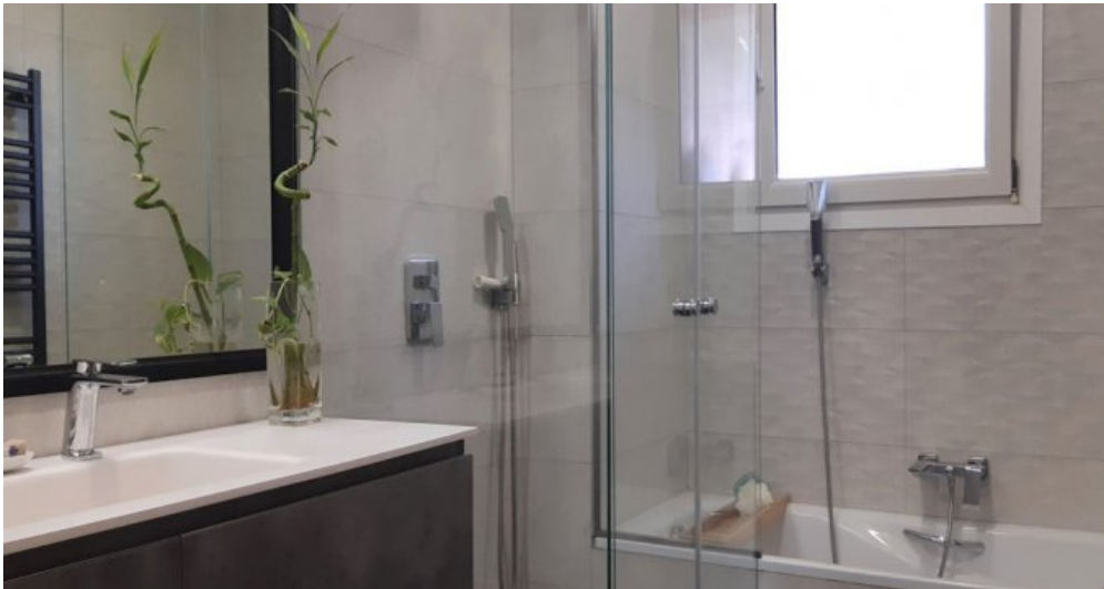
Ferienhaus Lloret Blau an der Costa Brava