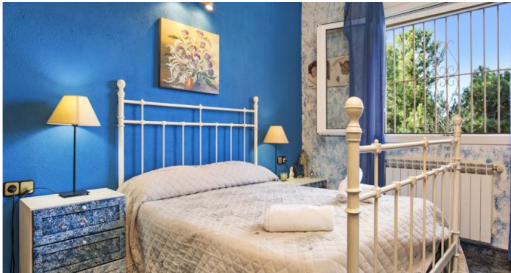
Ferienhaus Lloret Blau an der Costa Brava