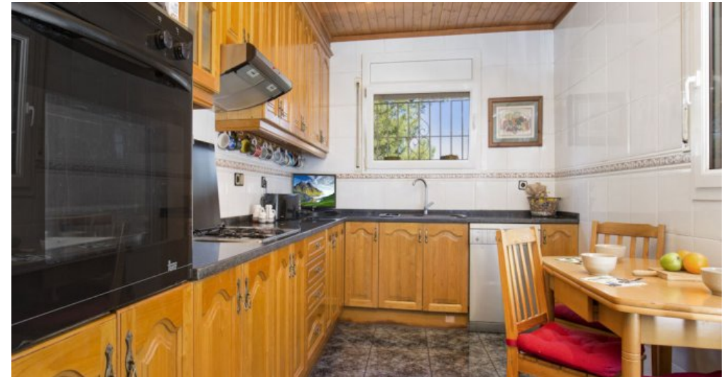
Ferienhaus Lloret Blau an der Costa Brava