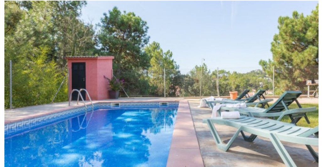
Ferienhaus Lloret Blau an der Costa Brava