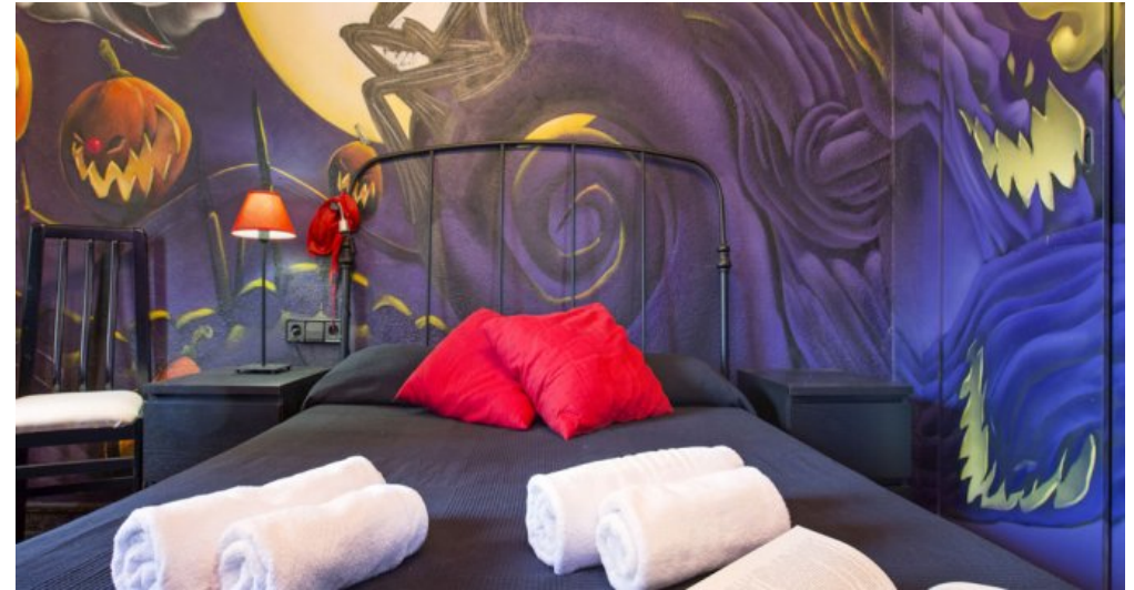
Ferienhaus Lloret Blau an der Costa Brava