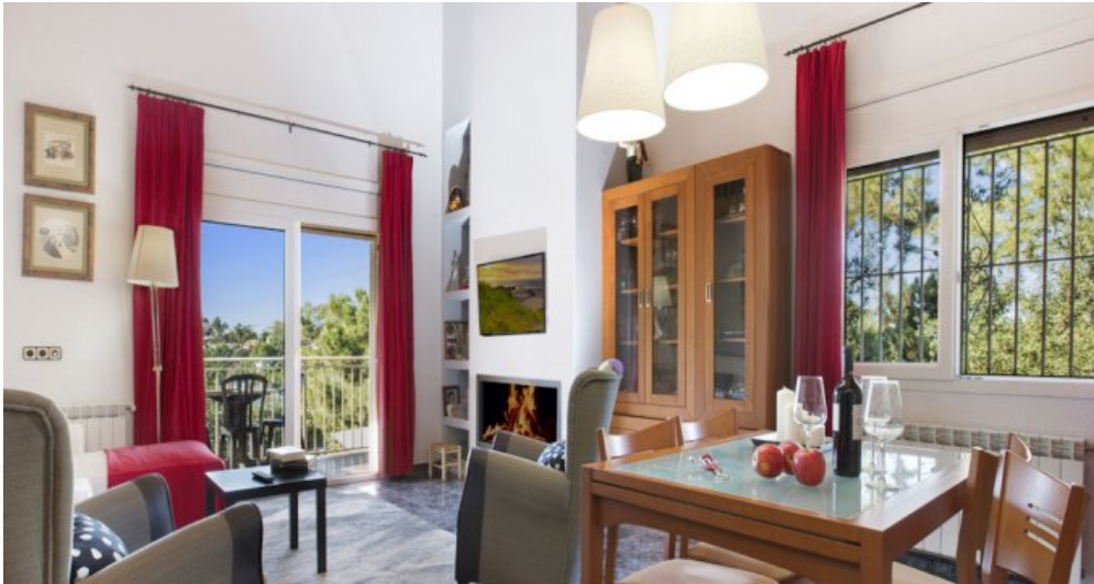
Ferienhaus Lloret Blau an der Costa Brava