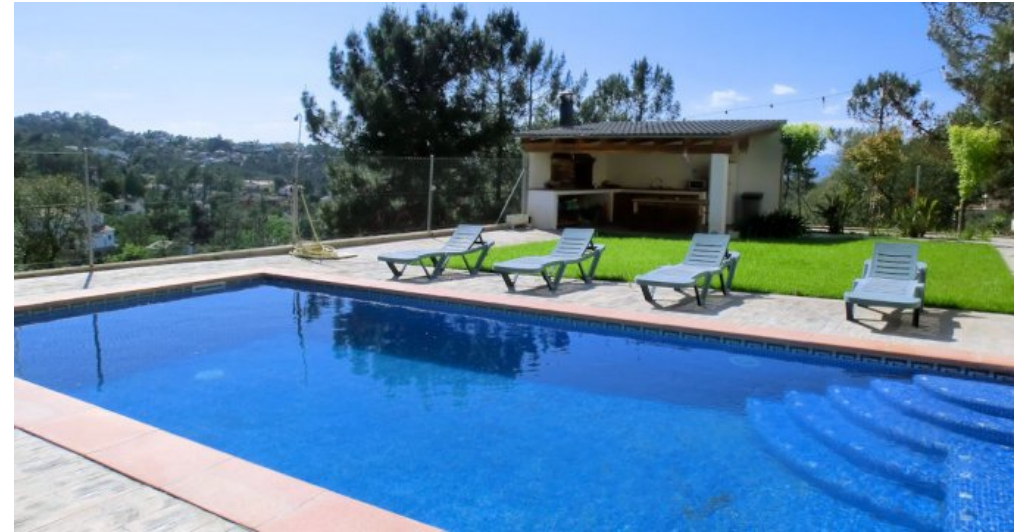
Ferienhaus Lloret Blau an der Costa Brava