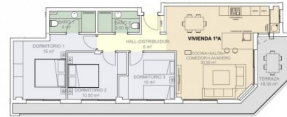
PLANTA PISO 1° VIVIENDA A