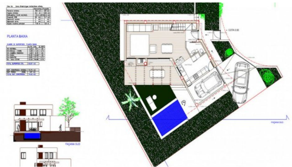
Neubau Fereinhaus in l'Escala an der Costa Brava