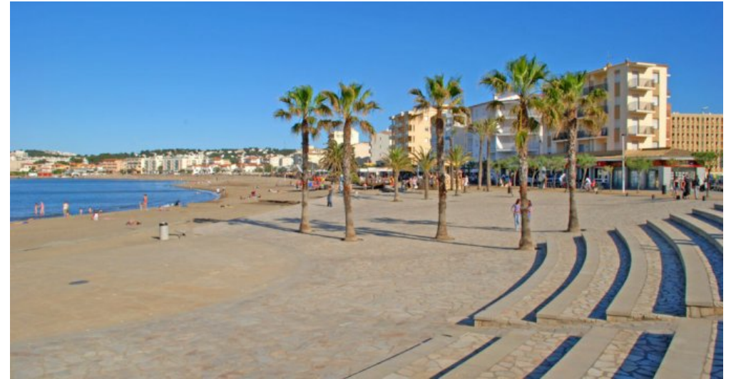
Spanien l'Escalade an der Costa Brava