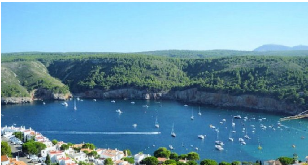
Spanien l'Escalade an der Costa Brava