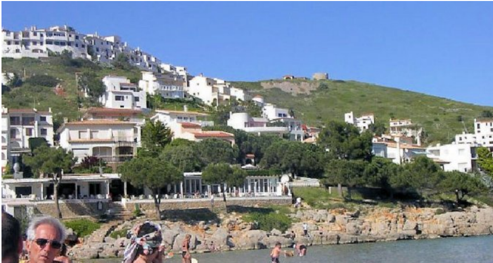
Spanien l'Escaló an der Costa Brava