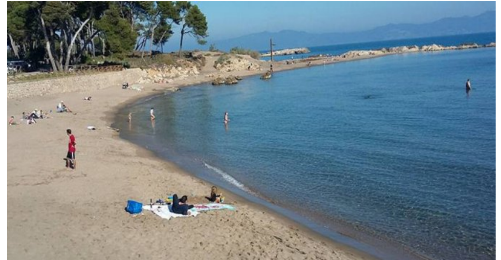
Spanien l'Escaló an der Costa Brava