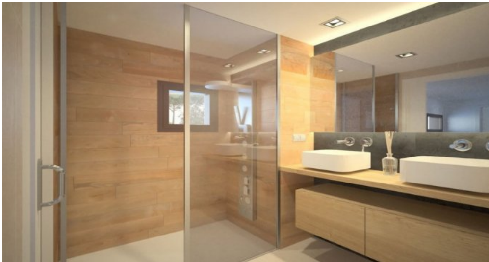
Neubau Fereinhaus in l'Escala an der Costa Brava