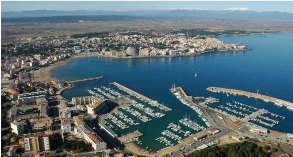
Spanien l'Escalade an der Costa Brava