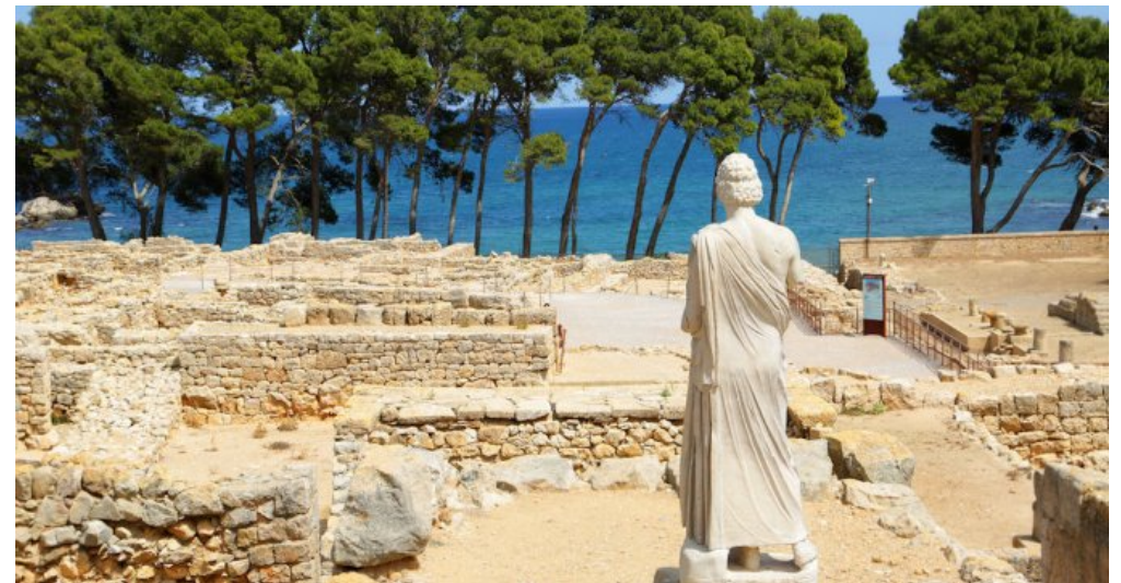
Spanien l'Escalade an der Costa Brava