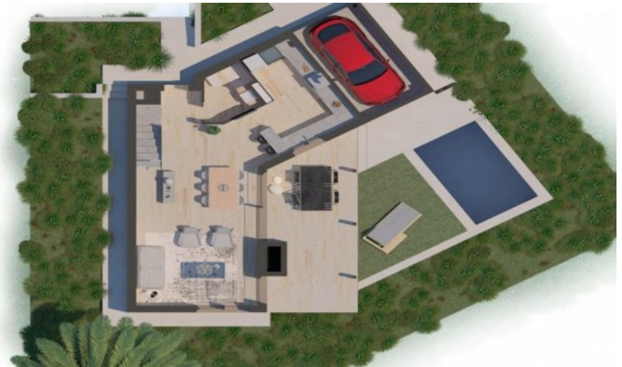
Neubau Fereinhaus in l'Escala an der Costa Brava