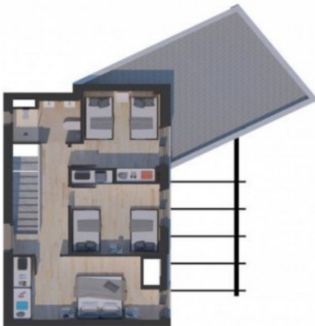
Neubau Fereinhaus in l'Escala an der Costa Brava