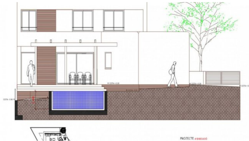
Neubau Fereinhaus in l'Escala an der Costa Brava