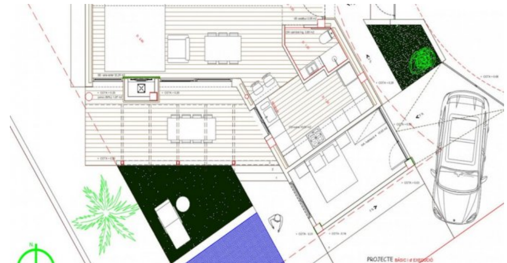
Neubau Fereinhaus in l'Escala an der Costa Brava